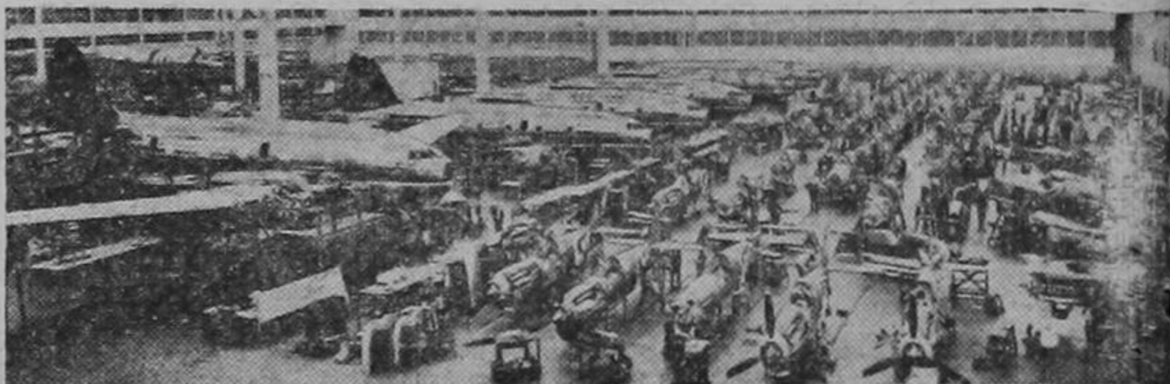
Aspecto que presenta la línea de montaje de una de las fábricas de la Curtiss Wright Corporation, de los Estados Unidos. A la izquierda, gigantes aviones de transporte de 25 toneladas, y a la derecha, docenas de aviones de caza del tipo P-40.