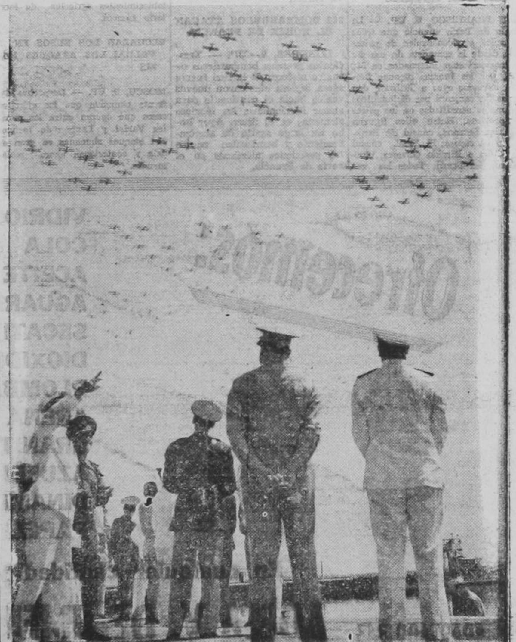
Miembros de la Junta Interamericana de Defensa presencian una grandiosa revista de la aviación de la marina de los Estados Unidos. A las maniobras asistieron representantes militares de diecisiete repúblicas americanas.